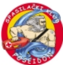
“Poseidon” DCK Primorsko-goranske županije